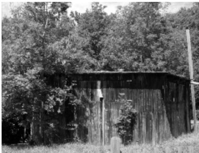
Die „Disco“, Juli 2011