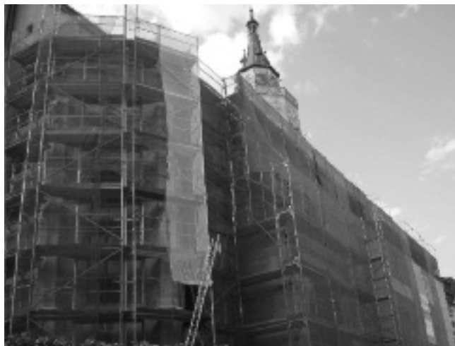
Noch ist die Stiftskirche „eingepackt“, August 2011