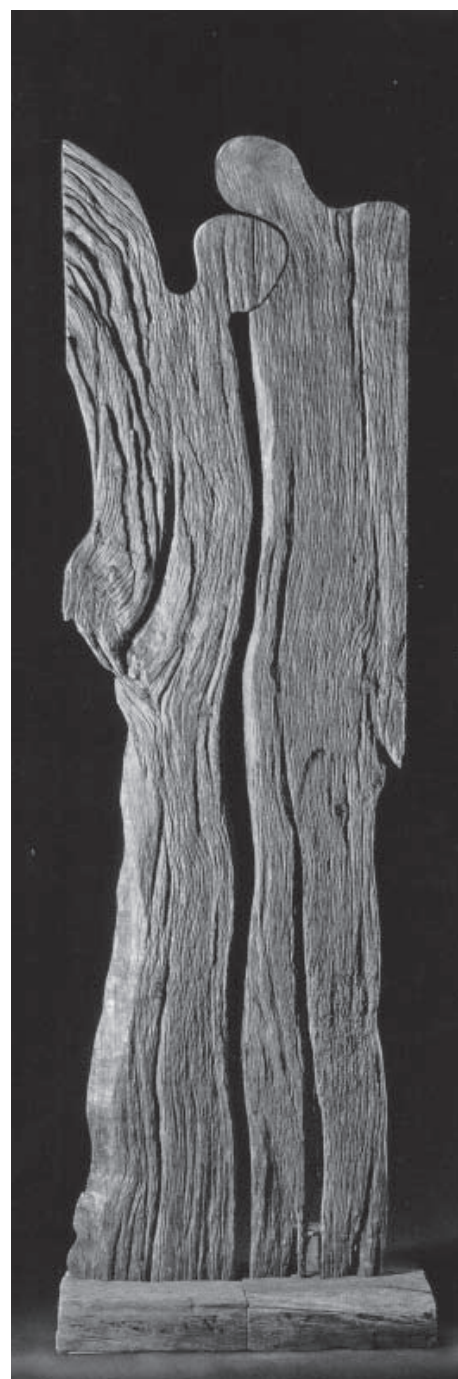
„Aufbruch“ (Höhe 246 cm, 1999)