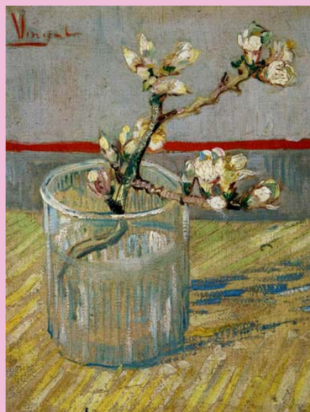
Van Gogh: Der Mandelzweig

Über Ben-Chorin und sein Lied „Freunde, dass der Mandelzweig“ informiert ausführlich das Internet unter dem Stichwort „Ben-Chorin“.