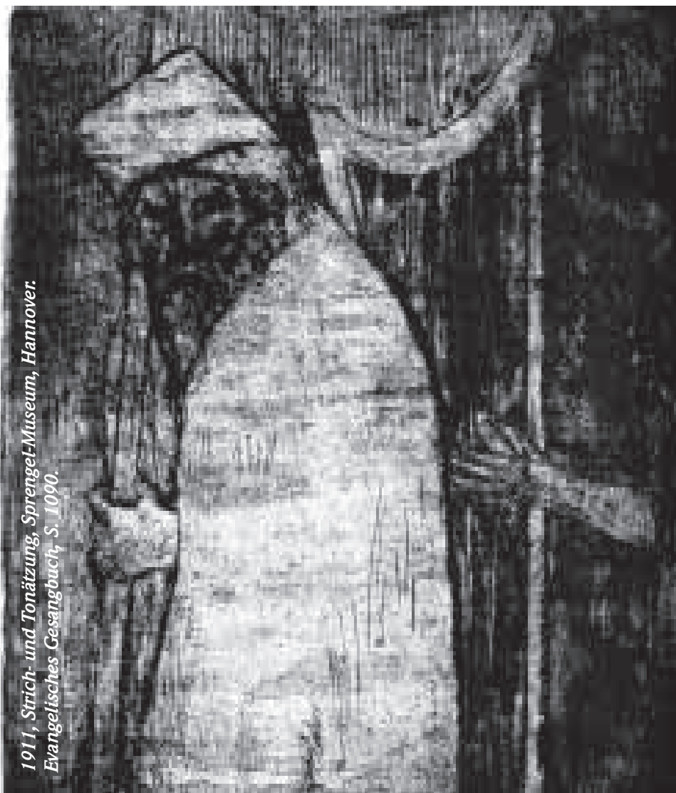
1911, Strich- und Tonätzung, Sprengel-Museum, Hannover. Evangelisches Gesangbuch, S. 1090.

Noldes graphisches Werk stellt einen in sich abgeschlossenen Komplex innerhalb seines Gesamtwerkes dar. Für seine biblischen Grafiken, die im Wesentlichen zwischen 1910 und 1913 entstanden sind, hat der Künstler sich einen freien und